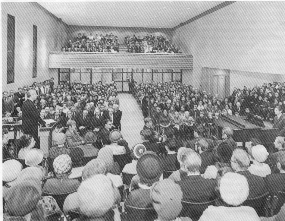
Bildet er tatt da pinsemenigheten Betel var 50 år, og viser et fullsatt lokale.

Mange, mange flere navn og begivenheter kunne vært nevnt, men dette er nevnt for å gi et lite, lite tverrsnitt av en menighetshistorie, som ville ha fylt en hel bok.